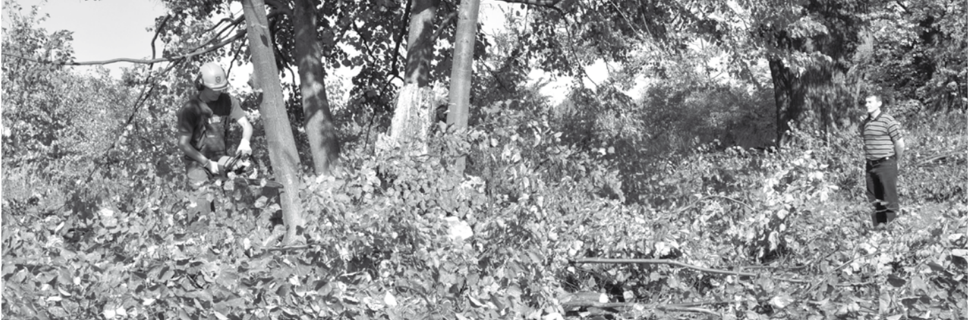
Zabiegami objęto cały drzewostan.