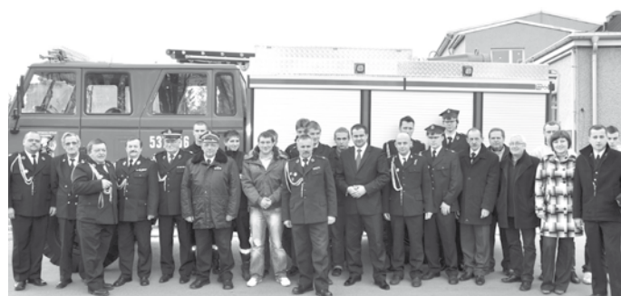
W tym roku nowe samochody trafiły do jednostek w Poraju i Jastrzębiu

Nowy zakup to samochód specjalny z funkcją rozpoznania chemicznego Land Rover Freelander o wartości 220 tys. zł. Wyposażony jest w lekkie ubrania przeciwchemiczne oraz sprzęt umożliwiający wykrywanie gazów toksycznych i wybuchowych.