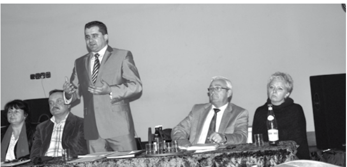
4.11.2011. Żarki Letnisko.