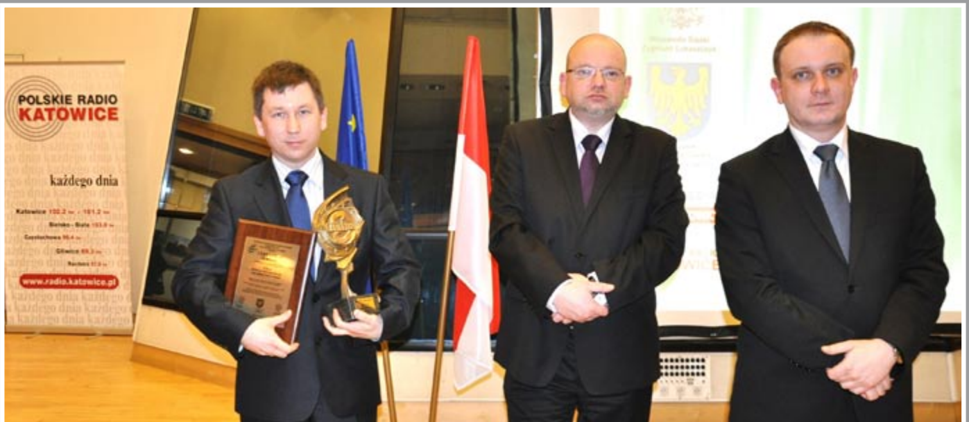
Lider Sportu 2011