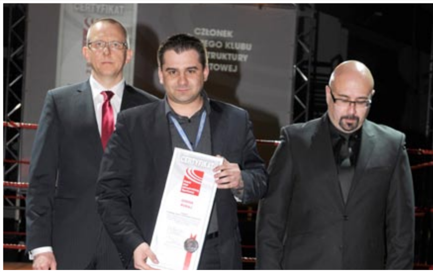
Certyfikat Polskiego Klubu Infrastruktury Sportowej

Tylko w tym roku za pracę, inicjatywę i aktywność Mieszkańców Gminy Poraj, Urząd Gminy został kilkakrotnie doceniony i uhonorowany prestiżowymi nagrodami i laurami.