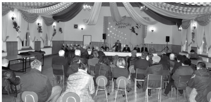
5.12.2011. Choroń. Dębowiec.