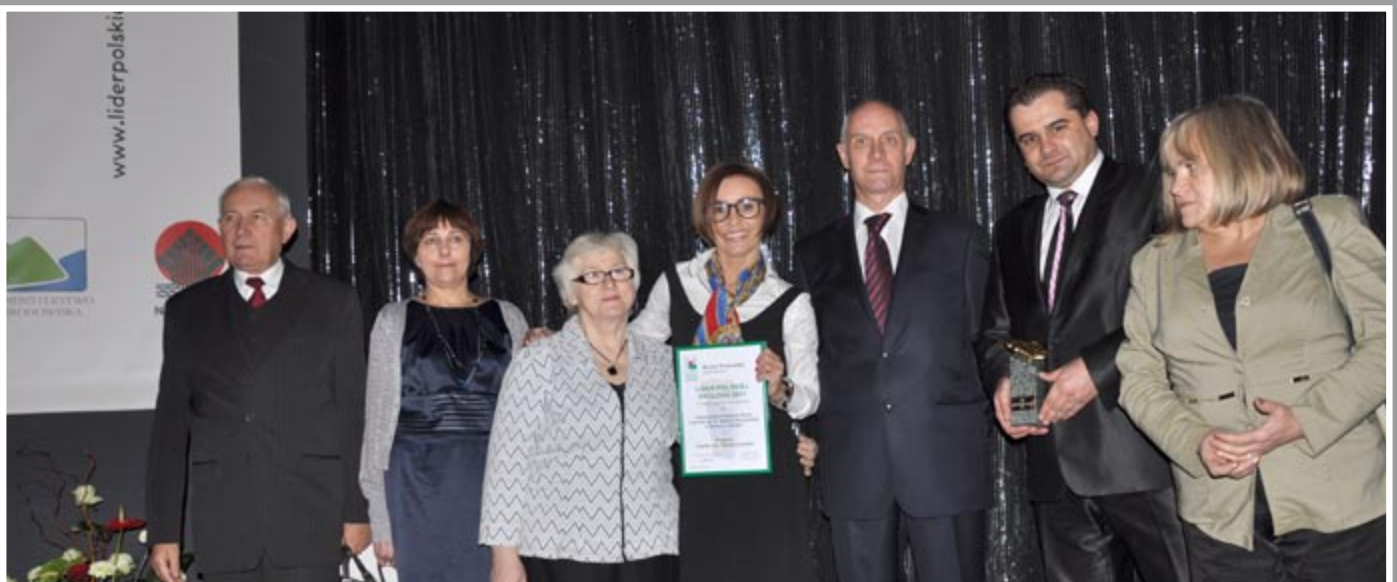
Lider Polskiej Ekologii 2011 dla TPŻL