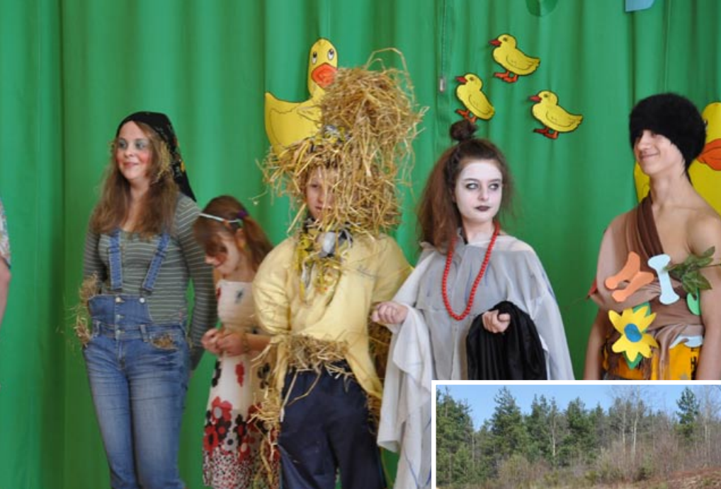
Gimnazjaliści powitali Pierwszy Dzień Wiosny