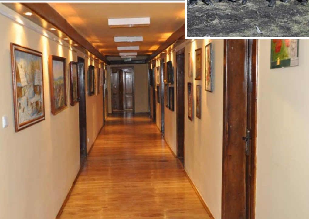
Wyremontowany budynek Gminnego Ośrodka Kultury robi wrażenie