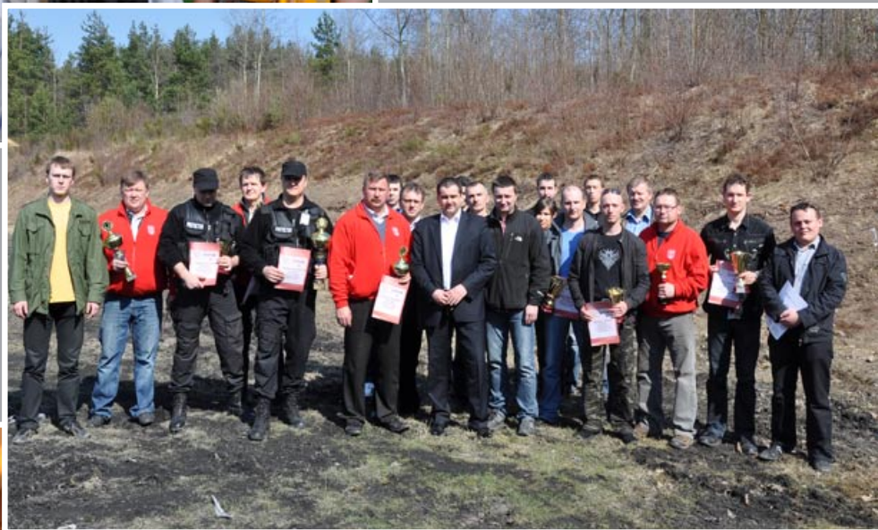
Ponad sto osób rywalizowało w zawodach strzeleckich o puchar Wójta Gminy Poraj